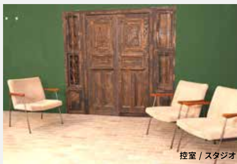
控室 / スタジオ