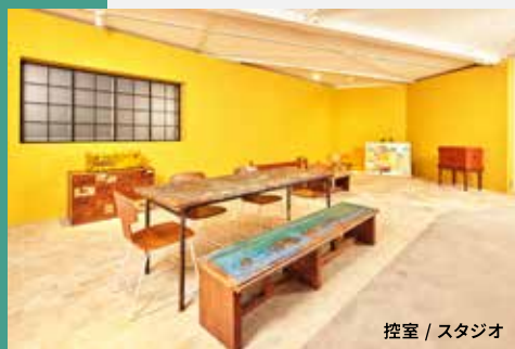
控室 / スタジオ